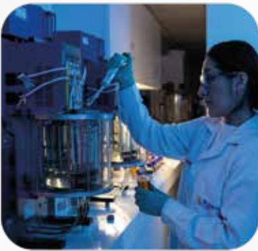
Personal altamente calificado.

Nuestro moderno laboratorio de calidad internacional, cuenta con personal altamente calificado para realizar ensayos. Nos permite desarrollar nuevos productos, realizar el control de calidad de productos terminados normados por ASTM (tanto para el análisis de aceites de nuestros clientes como para el control de calidad de la producción) y así cumplir con los más altos estándares internacionales de calidad y post venta.