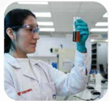
Control de calidad de productos en post venta y productos terminados.