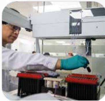
Equipos de última tecnología.